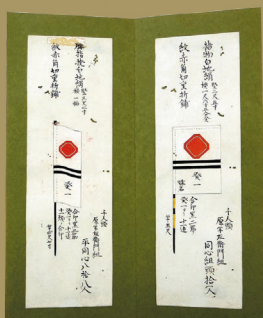
「千人同心頭組頭旗幟」個人蔵