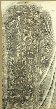
「飯田甚兵衛の地蔵(拓本)」江戸時代七飯町歴史館蔵